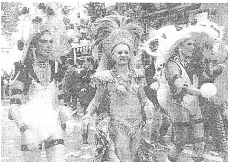
Гей-парад в Париже

-- Я уверен, что «голубой» любви не бывает. Люди нашего круга, на мой взгляд, интересуются в первую очередь материальной стороной: «если у тебя есть деньги, я буду с тобой, если нет -- пошел вон».