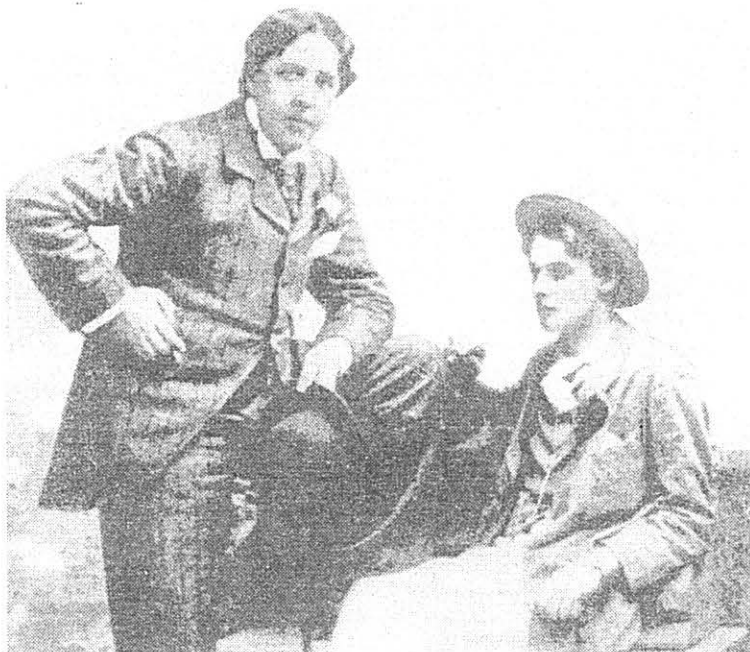
Оскар Уайльд и лорд Дуглас

По отцу -- ты потомок этого семейства, которое в ярости налагает руки на себя или на других. В самых незначительных случаях, в которых мы